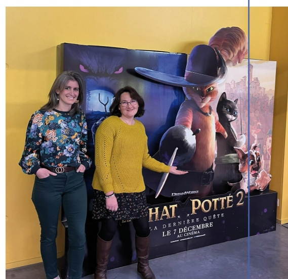
Projection du Chat Potté dans le cadre des festivités de fin d'année.