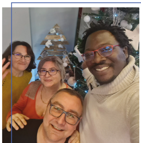
Arbre de Noël