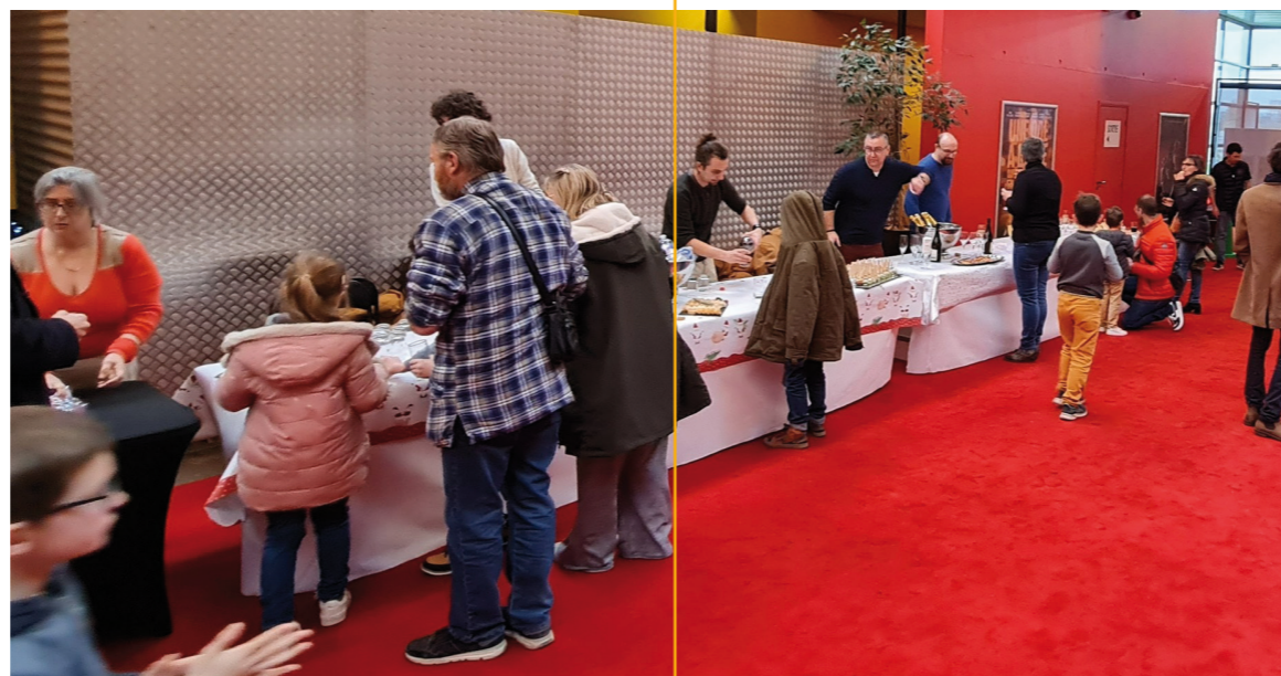
Goûter de Noël au Cap Ciné