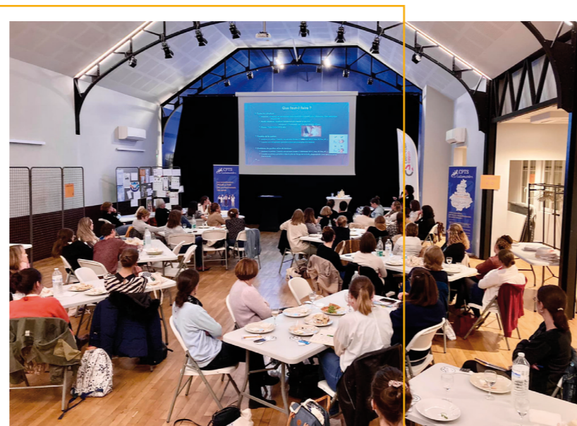
Conférence dans le cadre de la Semaine Mondiale de l'Allaitement Maternel